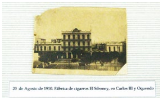
20 de Agosto de 1910. Fábrica de cigarros El Siboney, en Carlos III y Oquendo

Am Giebel des Hauses steht die Jahreszahl 1904. Worauf sich diese Jahreszahl bezieht, ist schwer zu sagen. Das Haus könnte in diesem Jahr erbaut worden sein. Dann wäre aber mit der Fabrik »El Siboney«, die von den Amerikanern zwischen 1898 und 1902 erworben wurde, zu dieser Zeit ein anderes Haus gemeint. Tatsächlich existiert in Havanna auf der Calle Gervasio No.576 ein Haus, an dessen Giebel »Fabrica de Cigarros El Siboney« steht (in der nächsten Folge wird diese Fabrik vorgestellt). Vielleicht befand sich die Produktion also vorher dort und wurde erst 1904 auf die Avenida Carlos III verlegt. In der Fabrik auf der Carlos III wurden jedenfalls Jahrzehnte lang Zigaretten hergestellt. Wie lange, ist leider nicht bekannt.