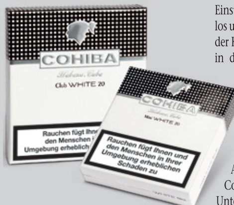
Cohiba White Mini & Club

Die neue, außergewöhnlich filigrane und feine Tabakmischung der Cohiba White ist das Ergebnis sorgfältiger Entwicklungsarbeit der erfahrensten Mischungsexperten Cubas. Neben vielschichtigen Aromen zeigt sich nur eine geringe Stärke, ohne dabei die cubanischen Wurzeln zu verleugnen. Die Cohiba White richtet sich deshalb vor allem an