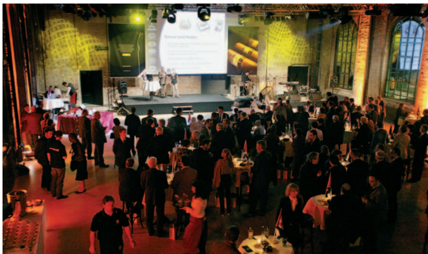
Beeindruckende Kulisse für die „Noche del Habano“: die Zeche Zollern

Das „European Cigar Cult Journal“ ehrte in diesem Jahr die Marke Bolívar als die „Beste cubanische Marke“ und die Montecristo Edmundo als die „Beste cubanische Cigarre“.