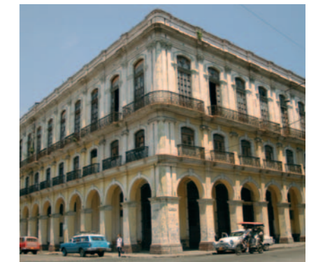
Einst ein großer Name und eine bedeutende Manufaktur, heute nahezu vergessen: Calixto Lopez

Es kam zu einer Zentralisierung der Zigarrenherstellung unter der Leitung von „Cubatabaco“. 1994 wurde „Habanos S.A.“ gegründet, eine Gesellschaft, die für die Vermarktung und den Verkauf der Habanos zuständig ist. Seit 2001 ist die Gesellschaft „Tabacuba“ für den kompletten Produktionsablauf verantwortlich.