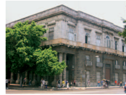
Palacio Aldama: Vor dem Bau der neuen Manufaktur Stammsitz der Marke La Corona

Der Unabhängigkeitskrieg, der Cuba in den letzten dreißig Jahren des 19. Jahrhunderts enorm schwächte, hinterließ das Land in einem wirtschaftlich desolaten Zustand. Beträchtliche Auswirkungen hatte das auch auf die Cigarrenindustrie.