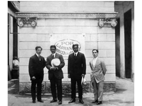
Eine der wenigen Fabriken oder Marken, die vom American Trust und anderen ausländischen Investoren unabhängig blieben, war Por Larrañaga

Im Jahre 1904 konnte die auch heute noch als Gebäude erhaltene berühmte neue Manufaktur „La Corona“ (Foto unten) fertiggestellt werden. Sie befindet sich direkt neben dem heutigen „Museo de la Revolucion“, dem ehemaligen „Palacio de Presidencial“, dem Präsidentenpalast. Dieser wurde allerdings erst später, im Jahre 1920, erbaut. Das Gebäude der „La Corona“-Manufaktur war die damals erste Stahlkonstruktion auf Cuba und wurde deshalb unter dem Namen „Palacio de Hierro“ oder „Iron-Palace“, Eisen-Palast, bekannt. Eine New Yorker Konstruktionsfirma errichtete das beeindruckende Gebäude für einen