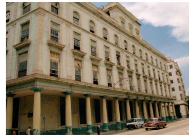
Die Manufaktur „La Corona“: Das 1904 errichtete und bis 2003 noch als Cigarrenfabrik genutzte Gebäude ist das erste Bauwerk mit einer Stahlkonstruktion auf Cuba (Palacio de Hierro).

Einer der großen Investoren war Gustav Bock, Mitbegründer der „Havana Cigar & Tobacco Factory“, eines Konsortiums, das sich sehr stark auf dem cubanischen Markt