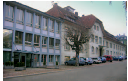
Villiger-Gebäude im Jahre 1910 (links), in den 70er Jahren, inzwischen um weitere Gebäudeteile erweitert (Mitte) und heute (rechts)