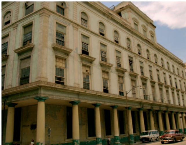
Cigarrenfabrik La Corona

Zum American „Trust“ gehörten oder kamen eine Vielzahl weiterer Firmen: darunter „Henry Clay - Bock & Co.“, welche die Marke „Cabañas“ um 1900 übernahm.