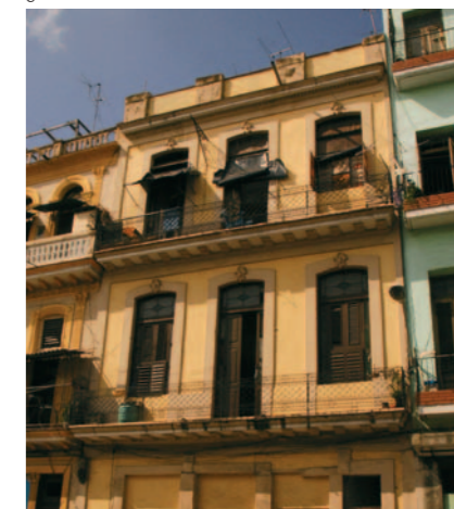
Calle Zanja No. 62

Die Chinchales entwickelten sich zu einer bedeutenden Kleinindustrie und zu einer Konkurrenz für die „Real Factoría“. Denn nicht nur die Lieferanten waren vom Angebot der „Chinchales“ beeindruckt, auch viele Beschäftigte der „Real Factoría“ schauten nach den wesentlich besseren Löhnen, die in den „Chinchales“ gezahlt wurden.