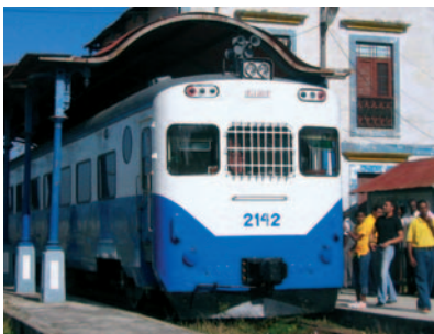
Eine Fahrt mit dem „Smokers-Train“ gehört auch beim nächsten Festival wieder zum Programm

Das „IX. Festival del Habano“ in Havanna begrüßt in der Zeit vom 26. Februar bis 2. März 2007 seine Gäste. 5 TH Avenue bietet wie jedes Jahr eine einwöchige Reise zu dieser Veranstaltung an, die am 24. Februar beginnt und am 4. März endet.