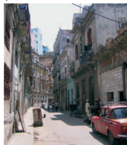
Calle San Miguel

Havanna befand sich Jahrhunderte lang unter spanischer Kolonialherrschaft. Das Tabakmonopol hielt die spanische „Real Factoría“, eine Gesellschaft, welche die gesamte Tabakproduktion in Cuba bis hin zum Export nach Spanien steuerte und überwachte, fest in den Händen. Schnupftabak und Kautabak waren gefragt in Europa und der restlichen Welt. Cigarren spielten keine so bedeutende Rolle; sie wurden nur in