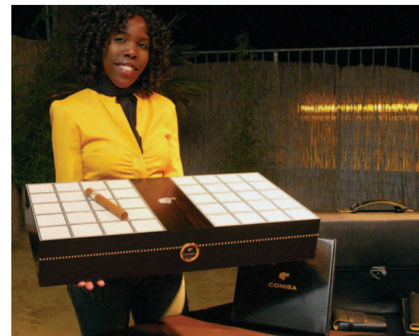
Cohiba Humidor „Behike“

Die „Deutsche Tabakzeitung“ lobt alljährlich die „Inter-tabac-Stars“ aus. Die Besucher der Messe können jeweils in verschiedenen Kategorien ihre Favoriten wählen. In der Rubrik „Interessanteste Produktneuheit“ in der Kategorie „Cigarre“ überzeugte die von Habanos S.A. erst beim Festival del Habano 2006 eingeführte „Romeo y Julieta Short Churchill“.