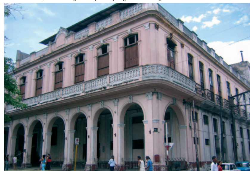
Die alte Fabrik auf der Calle Carlos III. No. 713

Die 5 th Avenue möchte an die Bedeutung dieser Marke erinnern und hat deshalb als „Edicion Regional“ ein klassisches Format der Marke „Por Larrañaga“ wiederaufleben lassen: die „Por Larrañaga Lonsdale“. Es handelt sich dabei um eine Cervantes mit einem Ringmaß von 42 und einer Länge von 165 mm.