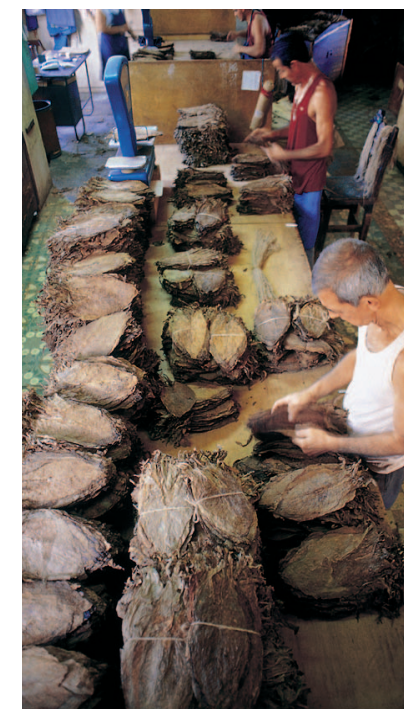
In diesem Raum, La Barajita genannt, werden die Mischungen für die Cigarren zusammengestellt

Die Aufgabe des Ligadors ist es auch, täglich den Geschmack der jeweilig verwendeten Blätter zu überprüfen. Denn ein Meisterligador kennt die Rezeptur jeder Marke und jeden Formates und ist auch zuständig dafür, dass diese Rezeptur eingehalten wird.