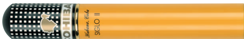
Cohiba Siglo II im Tubo