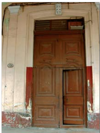
So sah die Tür mit der Aufschrift „Establecida 1834“ noch vor einem Jahr aus.

ausgelagert. Seitdem, bis 2011, stand das Gebäude leer. Wie in Havanna üblich, saß vor der Tür auf einem Stuhl ein alter Mann oder eine alte Frau, die das Gebäude bewachten. Nun hat die Sanierung begonnen. Im Sommer 2011 war das Innere des Hauses vollständig entkernt. Wert wurde allerdings darauf gelegt, die noch vorhandenen Überreste einstiger Schönheit zu erhalten. Es bleibt zu hoffen, dass man die aufwändigen Stuckarbeiten an den Rundbögen und Fenstern beispielsweise auch in Zukunft noch bewundern werden kann.