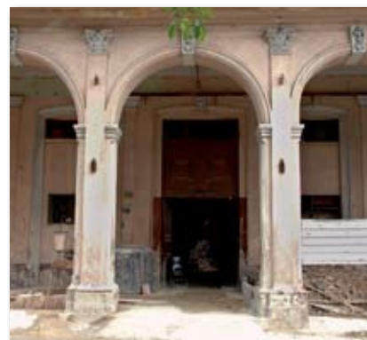
Seit 2011 wird gebaut. Es bleibt abzuwarten, wie das Gebäude nach der Sanierung aussehen wird.

Larrañaga 1882 unter seinem Namen registrieren ließ. Deshalb gilt er oft als Gründer der Marke. In Metropolen wie Berlin, Paris, London, St. Petersburg oder Wien war die Por Larrañaga die „Cigarre par excellence“. Unzählige Auszeichnungen bestätigten die hohe Qualität dieser