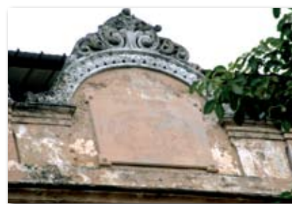
Bei sehr starker Vergrößerung erkennt man noch den Schriftzug Por Larrañaga.

Bis 2004 war die Manufaktur in Betrieb, dann wurde das Haus, wahrscheinlich wegen seiner auffälligkeit, geschlossen und die Produktion