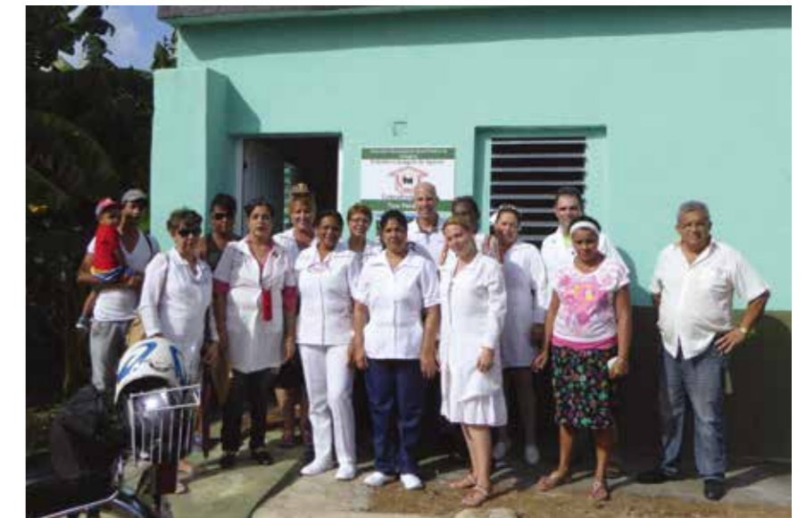
Mitarbeiter und Helfer vor der frisch renovierten Arztpraxis Florat.