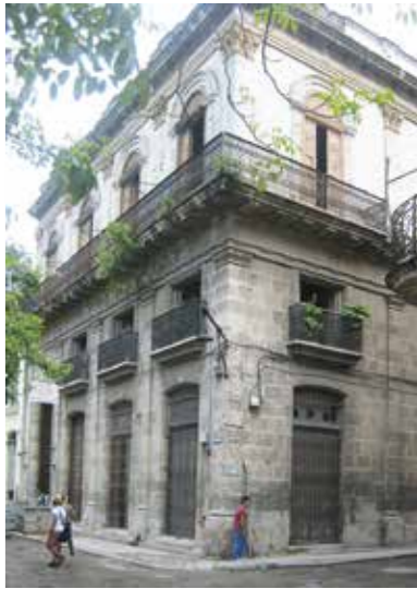
Das Haus befindet sich an der Plaza Cristo, hier im Bild direkt hinter dem Denkmal und den Bäumen versteckt.

Conills Wohn- und Lagerhaus befindet sich mitten in der Altstadt Havannas und ist auch heute noch sehr gut erhalten. Zu finden ist es auf der Calle Brasil, oder auch Teniente Rey, No.405, einer Parallelstraße der Calle Obispo, an der Ecke zur Calle Cristo. Das palastähnliche Haus wurde für Juan Conill im Jahr 1869 erbaut und zeugt auch heute noch vom Wohlstand seines Besitzers.