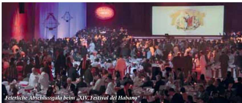
Feierliche Abschlussgala beim „XIV. Festival del Habano“

Detaillierte Informationen, auch den Flug und Hotels betreffend, finden sie demnächst unter www.5thavenue.de .