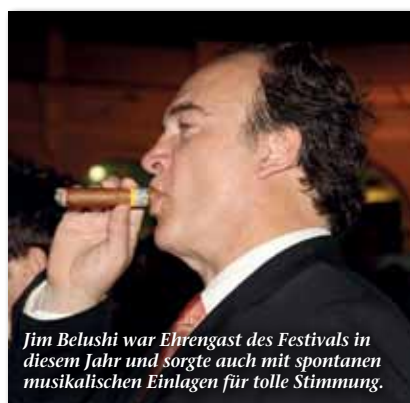
Jim Belushi war Ehrengast des Festivals in diesem Jahr und sorgte auch mit spontanen musikalischen Einlagen für tolle Stimmung.

Höhepunkt des Festivals ist, wie in jedem Jahr seit dem Bestehen des Festivals, die feierliche Abschlussgala, diesmal am Sams-