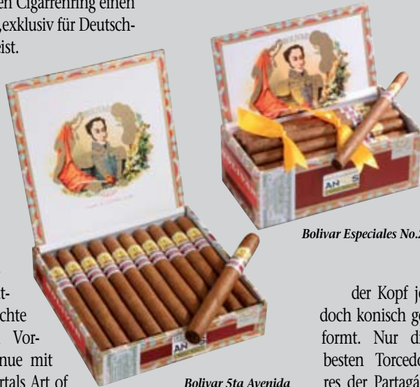
Bolívar 5ta Avenida

5 TH AVENUE beschränkt bei der Auswahl als erster Habanos-Importeur weltweit neue Wege. Die Entscheidung für die Marke und die Formate trafen erstmals die Cigarrenliebhaber selbst. Ein deutscher Aficionado machte diesen innovativen Vorschlag, den 5 TH AVENUE mit Hilfe des Internetportals Art of Smoke umsetzte. Die Aficionados entschieden sich sowohl für die Marke wie auch die Formate in zwei Runden mit mehr als 1.100 Stimmen für diese beiden. Dass in beiden Fällen die Wahl auf Bolívar fiel, spricht sicher für die Beliebtheit dieser Marke.