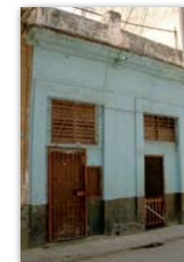
In diesem Haus mit der No. 58 befand sich der Firmensitz der Marke Por Larrañaga.

Auf der Calle San Miguel No. 20, zwischen dem Paseo del Prado und der Calle Consulado, hatte laut einiger Quellen die Marke Partagás bereits 1820 ihre erste Adresse. Da Don