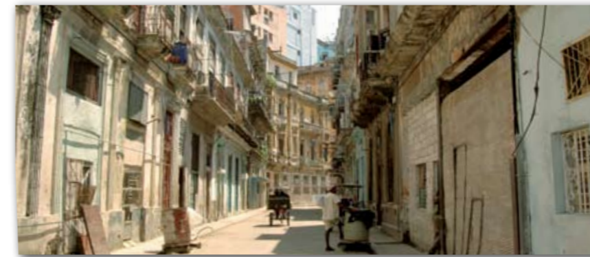
Enge Straße, immer wird gebaut, immer ist etwas kaputt. Hier auf der Calle San Miguel befand sich der Firmensitz der Marke Partagás. Auch die Marke H.Upmann hat hier ihre Wurzeln.

Auf der Suche nach einem historisch bedeutenden Ort in der Geschichte der Cigarre sollte man sich auf die Calle San Miguel in Havannas Stadtteil Centro Habana begeben. Dies ist der Stadtteil, der noch zu Zeiten des Bestehens der alten Stadtmauer als erstes neben der Altstadt Havannas entstanden ist und zu den eher selten von Touristen aufgesuchten Bezirken zählt. Die Calle San Miguel ist eine kleine Querstraße zum Paseo del Prado (heute Paseo de Martí), der berühmtesten Prachtstraße Havannas, an deren Ende sich das Capitolio befindet, deren anderes Ende direkt zum Malecón führt. Doch die Calle San Miguel ist keine Prachtstraße. Auf ihr stehen keine großen, beeindruckenden Paläste. Stattdessen sind die Häuser klein, weitgehend schmucklos und heute in