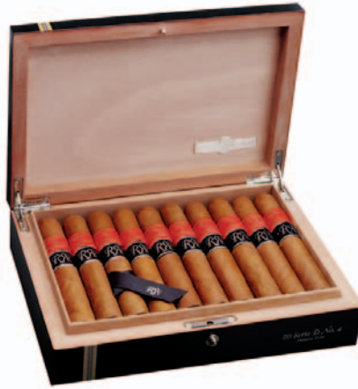
Partagás Serie D No.4 Reserva

Von der Partagás Serie „D No. 4 Reserva“ gibt es weltweit nur insgesamt 5.000 einzeln nummerierte Kisten.