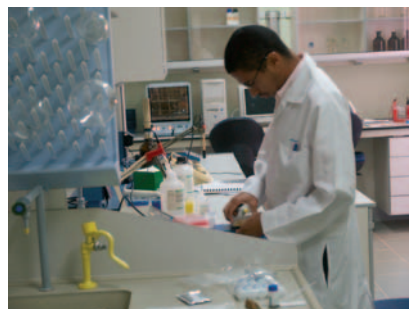
Tabakforschungsinstitut Instituto de Investigaciones del Tabaco (IIT)