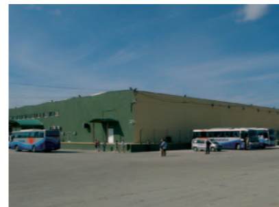
Neues Habanos-Zentrallager, Außen- und Innenansicht